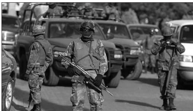
QUÂN ĐỘI MEXICO LÀ LỰC LƯỢNG TIÊN PHONG CHỐNG MA TUÝ