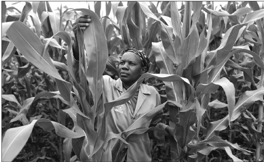
CHƯƠNG TRÌNH CÁCH MẠNG XANH ĐANG LÀM TỔN HẠI CHÂU PHI

ỦY BAN NOBEL NA UY MỜI ĐÂY BẮT NGỜ TRAO GIẢI NOBEL HÒA BÌNH NĂM 2020 CHO CHƯƠNG TRÌNH LƯƠNG THỰC THẾ GIỚI (WFP) CỦA LIÊN HỢP QUỐC (LHQ), QUA ĐÓ GỬI ĐI MỘT THÔNG điệp RẰNG THẾ GIỚI NÊN “HƯỚNG SỰ CHÚ Ý ĐẾN HÀNG TRIỆU NGƯỜI DÂN ĐANG PHẢI HƯNG CHỊU HOẶC ĐỐI DIỆN VỚI MỖI ĐE ĐỌA CỦA NẠN ĐÓI”. NHỮNG CON SỐ NÀY HIỆN ĐANG LỚN HƠN BAO GIỜ HẾT VÀ HỆ THỐNG LƯƠNG THỰC TOÀN CẦU HIỆN ĐANG BỊ CHỈ TRÍCH NẶNG NỀ.