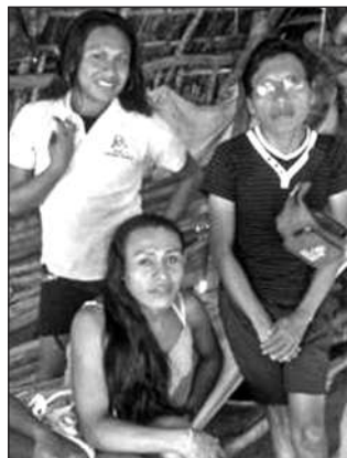
GIỚI TÍNH THỨ BA, HAY CÒN GỌI LÀ OMEGGID, LÀ HIỆN TƯỢNG HOÀN TOÀN BÌNH THƯỜNG TRÊN ĐẢO

kỹ thuật để thêu được những trang phục mola phức tạp nhất.