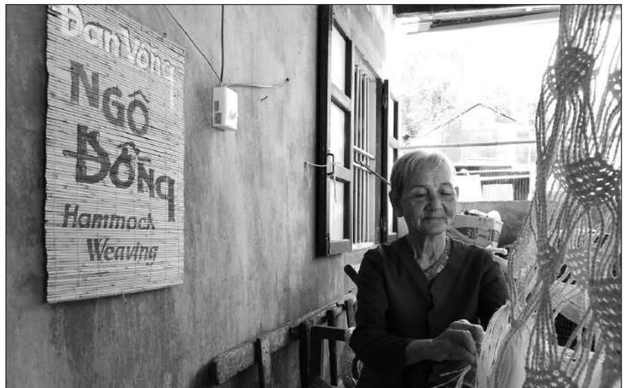
BÀ QUY VÀ CHIẾC VÕNG ĐAN ĐỎ