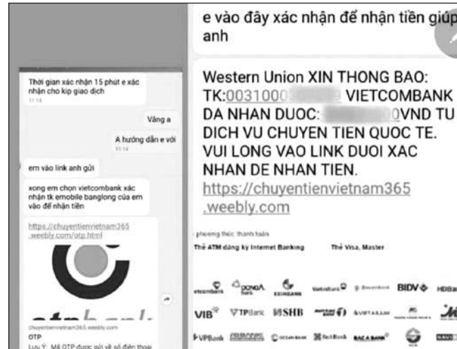
ĐỐI TƯỢNG THƯỜNG DẪN DỤ BỊ HẠI TRUY CẬP VÀO WEBSITE GIẢ MẠO ĐỂ CHIẾM ĐOẠT TÀI KHOẢN NGÂN HÀNG

NHỮNG NĂM GẦN ĐÂY, VIỆC MUA/BÁN HÀNG QUA MẠNG INTERNET VÀ THANH TOÁN TRỰC TUYẾN ĐÃ NGÀY MỘT TRỞ NÊN QUEN THUỘC VỚI NHIỀU NGƯỜI DÂN. ĐẶC BIỆT SAU KHI ĐẠI DỊCH COVID-19 BÙNG NỔ, XU HƯỚNG GIAO DỊCH, THANH TOÁN QUA MẠNG Càng TRỞ NÊN PHỔ BIẾN. TUY NHIÊN LỢI DỤNG SỰ CẢ TÍN, THIẾU KỸ NĂNG CỦA MỘT BỘ PHẬN THƯỜNG GIA VÀ KHÁCH HÀNG, ĐÃ XUẤT HIỆN NHIỀU ĐỐI TƯỢNG CHUYÊN NHẢM VÀO CÁC GIAO DỊCH TRỰC TUYẾN ĐỂ LỪA ĐẢO, CHIẾM ĐOẠT TIỀN CỦA BỊ HẠI.