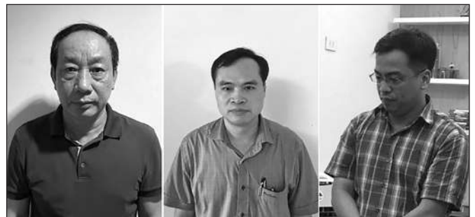
CÁC BỊ CAN NGUYỄN LÀ LÃNH ĐẠO BỘ GTVT BỊ TRUY TỐ