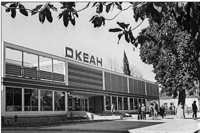
CỬA HÀNG CÁ ĐẠI DƯƠNG TẠI SOCHI, NĂM 1979