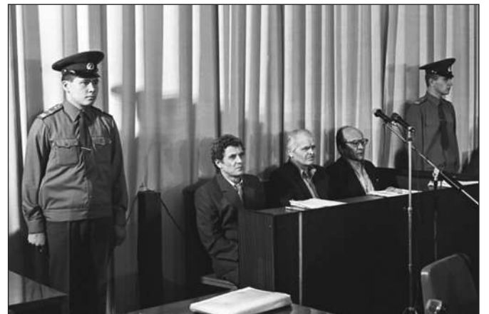
XÉT XỬ VỤ ÁN "MAFIA CÁ"