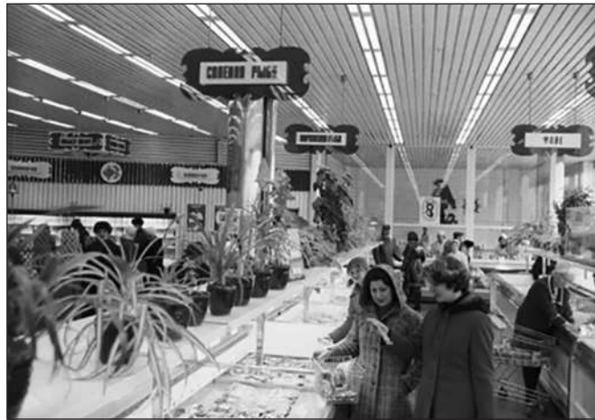
BÊN TRONG MỘT CỬA HÀNG CÁ THEO PHONG CÁCH MỚI

Tuy nhiên, đầu mối chính để tìm ra "Mafia Cá" lại bắt nguồn từ một sự cố hy hữu tại một cửa hàng Đại Dương ở Moscow. Có một cựu chiến binh sau giờ làm đã đến cửa hàng Đại Dương mua một lọ nhỏ cá sốt cà chua. Về nhà ông mở nắp và kinh ngạc bởi trong lọ lại là trứng cá đen. Cho rằng có sự nhầm lẫn, cựu chiến binh trung thực này đã cầm chiếc lọ trở lại cửa hàng và đưa cho nhân viên bán hàng xem trước mặt tất cả khách hàng. Ban quản lý