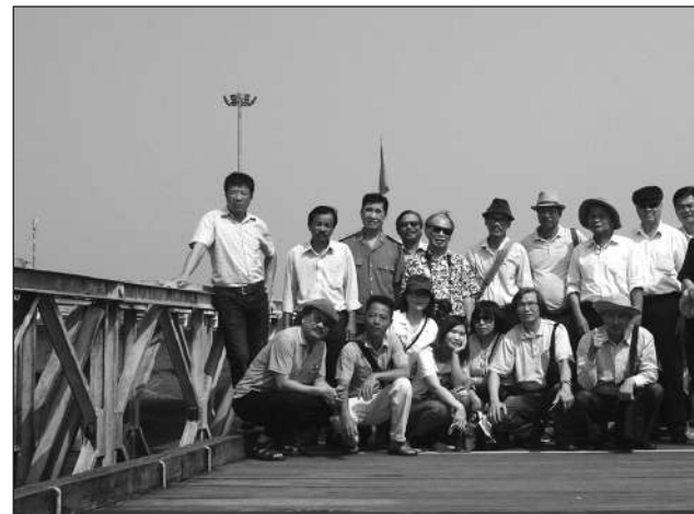
CÁC NHÀ VĂN THAM QUAN THỰC TẾ TẠI CẦU HIỀN LƯƠNG (QUẢNG TRỊ, THÁNG 10)

túy, là một câu chuyện cảm động của Phạm T nếu rõ một trong những đúng đắn của Bộ - Tinh mạnh - Huy bácm cơ sở". Tác được sự thành công án, đó là biết cá cơ sở an ninh từ c nhằm đổi mới v thống nhất được Bộ xuống đến c nắm các đối tượng các chuyên án. cảnh khó khăn c vào con đường được cái nhìn m