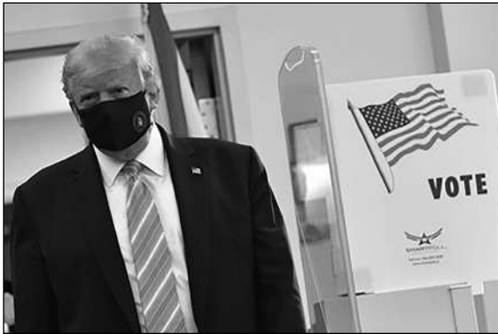
ÔNG DONALD TRUMP ĐANG RẤT NỖ LỰC TRONG NHỮNG NGÀY CUỐI CÙNG TRƯỚC CUỘC BẦU CỬ 3-11

Trong các cuộc thăm dò trên toàn quốc, ứng viên tổng thống của đảng Dân chủ Joe Biden tiếp tục dẫn trước đường kim Tổng thống Donald Trump. Thế nhưng, vẫn chưa có gì là chắc chắn.