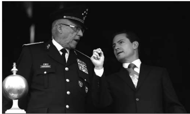
CỰU TỔNG THỐNG MEXICO ENRIQUE PEÑA NIETO VÀ CỰU BỘ TRƯỞNG QUỐC PHÒNG CIENFUEGOS ZEPEDA

Zepeda đã cho phép H-2 thường xuyên tham gia vào các vụ bạo lực bán buôn, bao gồm cả tra tấn và giết người. Đáng chú ý là các hoạt động này của H-2 không bị trừng phạt ở Mexico", các công tố viên liên bang cho biết trong một tuyên bố ủng hộ đề nghị ra lệnh tạm giam vĩnh viễn đối với cựu Bộ trưởng Quốc phòng Mexico.