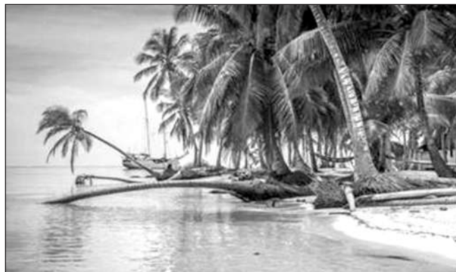
QUẦN ĐẢO GUNA YALA NẴM Ở NGOÀI KHỎI PHÍA ĐÔNG CỦA PANAMA, LÀ NƠI SINH SỐNG CỦA NGƯỜI GUNA BẢN ĐỊA

SAU KHI BĂNG QUA VÙNG NƯỚC TĨNH LẶNG TRÊN BIỂN CARIBBE, DU KHÁCH DƯỜNG NHƯ BỊ CHOÁNG NGỢP VỚI CẢM GIÁC NHƯ LẠC VÀO THIÊN ĐƯỜNG. NẮM RẢI RÁC GIỮA VÙNG NƯỚC XANH NGOC, QUẦN ĐẢO NHỎ BÉ XINH ĐẸP ĐẾN MỨC KHÔNG THỂ TIN NỔI VỚI BÃI CÁT TRẮNG LẤP LÁNH PHỐI MÌNH DƯỚI HÀNG CÂY CỌ VÀ RĂNG DỪA XANH BIẾC. GUNA YALA HAY CÒN GỌI LÀ SAN BLAS - QUẦN ĐẢO NẴM NGOÀI KHỎI KHU VỰC PHÍA ĐÔNG PANAMA GỒM HƠN 300 HÒN ĐẢO NHỎ NHƯNG CHỈ CÓ 49 ĐẢO CÓ CON NGƯỜI SINH SỐNG.