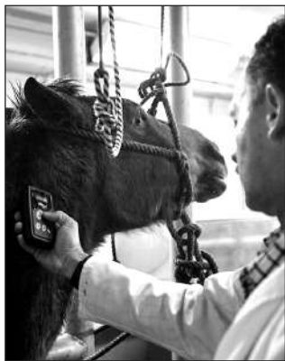
CÁC KỸ THUẬT VIÊN SẼ THU THẬP MÁU NGỰA VÀ TÁCH RA HUYẾT TƯƠNG GIỮA KHÁNG THỂ, NÓ ĐƯỢC LÀM SẠCH, LỌC KỶ, VÔ TRÙNG VÀ ĐÓNG GÓI TẠO THÀNH KHÁNG NOC. ICP SẢN XUẤT KHOẢNG 100.000 LỌ KHÁNG NOC/NĂM