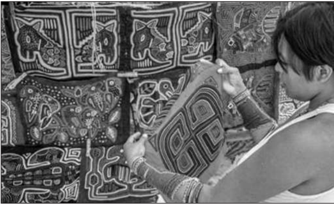
PHỤ NỮ GUNA CÓ THỂ KIẾM ĐƯỢC THU NHẬP ĐÁNG KỂ NHỜ BÁN CÁC BỘ MOLA THÊU PHỨC TẠP VÀ VÒNG WINIS