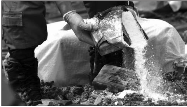
KHI CÓN ĐƯỜNG CHỨC, ÔNG CIENFUEGOS ZEPEDA TỪNG CHỈ HUY NHIỀU CHIẾN DỊCH TRUY QUÉT CÁC BĂNG NHÓM TỘI PHẠM ĐỐI THỦ CỦA H-2

Tờ The Guardian trích dẫn cáo trạng của các công tố viên Mỹ cho hay: "Bề ngoài, Tướng Cienfuegos Zepeda luôn thể hiện là hình ảnh của một chiến binh tiên tuyến chống lại các tổ chức buôn ma túy. Ông đã chỉ đạo lực lượng quân đội dồn ép các thủ lĩnh băng đảng ma túy và bắt giữ trùm ma túy khét tiếng Joaquin "El Chapo" Guzman hai lần trong hai năm. Nhưng các bằng chứng khác lại cho thấy, ông đã sử dụng quyền lực rộng lớn của văn phòng và quân đội không phải để làm gián đoạn việc vận chuyển ma túy mà để giúp một băng đảng được gọi là H-2. Trong hàng ngàn tin nhắn này, cựu Bộ trưởng Quốc phòng Mexico được trùm ma túy gọi với biệt danh "Padrino" hoặc "Bố già" - một nhà hảo tâm toàn năng, người đã đảm bảo hàng