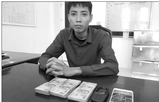
MỘT ĐỐI TƯỢNG CHUYÊN LỪA ĐẢO CÁC GIAO DỊCH TRỰC TUYẾN BỊ CƠ QUAN CÔNG AN BẮT GIỮ.