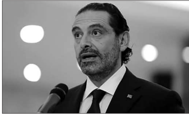
TÂN THỦ TƯỚNG LEBANON SAAD HARIRI