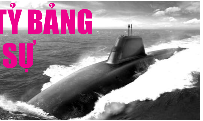
CHƯƠNG TRÌNH VŪ KHÍ HẠT NHÂN TRANG BỊ CHO TÀU NGẦM TRIDENT TỐN TIỀN NHIỀU NHẤT

MoD cũng cho biết đang chi khoản ngân sách tương đương 50 triệu bảng Anh cho chương trình không gian trong niên hạn 5 năm. Chiến lược mới của Không lực Hoàng gia Anh (RAF) cam kết rằng "Anh sẽ được cung cấp