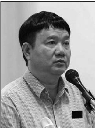
BI CAN ĐINH LA THĂNG