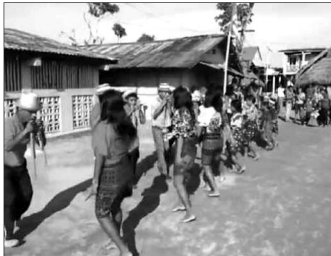
PHỤ NỮ Ở QUẦN ĐẢO GUNA YALA ĐƯỢC VINH DANH VỚI 3 NGHI LỄ QUAN TRỌNG NHẤT LÀ LỄ SINH CON GÁI, LỄ DẬY THÌ VÀ Đám CƯỚI

Hiện nay với nền du lịch phát triển, người Guna bắt đầu kiếm tiền từ các nguồn khác, ngoài cách buôn bán từ xa xưa như thu hái dừa, lặn tìm tôm hùm, đánh cá và làm nông. Phụ nữ Guna có thể kiếm được thu nhập đáng kể nhờ bán cho du khách các trang phục thêu mola phức tạp và vòng winis (loại vòng