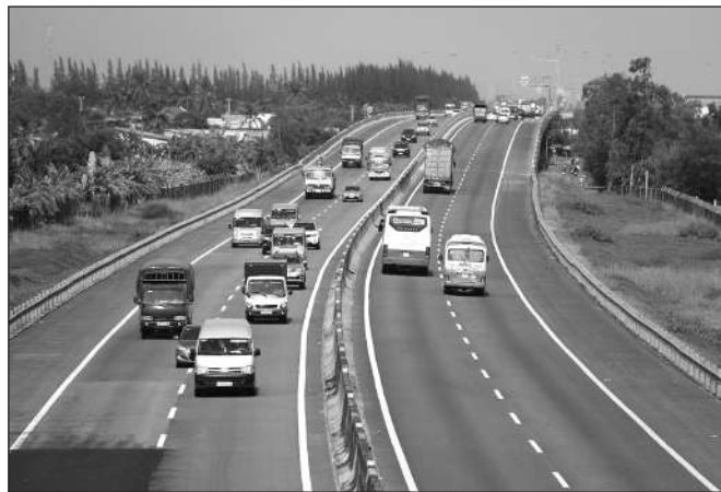
NHIỀU SAI PHẠM LIÊN QUAN ĐẾN DỰ ÁN CAO TỐC TP. HỒ CHÍ MINH - TRUNG LƯƠNG

Sau 3 tháng nhận chức Bộ trưởng Bộ GTVT, ngày 8-11-2011, bị can Đinh La Thăng đã có văn bản kiến nghị gửi Thủ tướng Chính phủ, nội dung tiếp nhận quyền thu phí, tìm đối tác trong và ngoài nước để đàm phán chuyển giao quyền thu phí đường cao tốc TP. Hồ Chí Minh - Trung Lương. Trên cơ sở đề nghị này, Thủ tướng