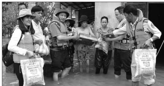
NHỮNG SUẤT QUÀ NGHĨA TÌNH CỦA BÁO CAND VÀ NHÀ TÀI TRỢ ĐẾN VỚI NGƯỜI DÂN VÙNG NGẬP LỤT Ở MIỀN TRUNG