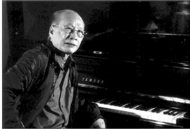
NHẠC SĨ VĂN KÝ

đứng lên phát biểu đồng ý và đầy xúc cảm trong tiếng vỗ tay rào rào của người hâm mộ. Tôi nhớ hôm ấy đưa ông về chung cư đã gần 22h đêm nhưng nét mặt ông vẫn vui vẻ, rạng rỡ, không biểu hiện một chút mệt mỏi nào.