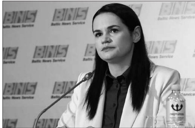
THỦ LĨNH ĐỐI LẬP LƯU VONG BELARUS - BÀ SVETLANA TIKHANOVSKAYA

công bố: sản lượng đang giảm, như thể có nhiều đại dịch đang tấn công nước này. Một số ngành công nghiệp địa phương, những ngành mà Liên Xô và Ukraine vốn rất tự hào - ngành hàng không, đóng tàu, chế tạo tên lửa - được phát triển bởi các thế hệ người Liên Xô, từ tất cả các nước cộng hòa thuộc Liên Xô, là một di sản Ukraine cũng có thể và nên tự hào - đã gần như biến mất. Ukraine đang phi công nghiệp hóa".