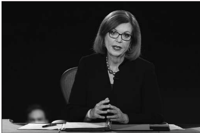
TRƯỚC KHI TRỞ THÀNH TRƯỞNG VĂN PHÒNG WASHINGTON CỦA TỜ USATODAY, SUSAN PAGE TỪNG CÓ THỜI GIAN LÀ PHÓNG VIÊN NHÀ TRẮNG.

Susan Page, Trưởng văn phòng Washington của tờ USA Today đã điều hành khá tài tình cuộc tranh luận duy nhất giữa Phó Tổng thống đương nhiệm Mike Pence và ứng cử viên Phó Tổng thống của đảng Dân chủ Kamala Harris tại Đại học Utah ở thành phố Salt Lake. Bà nói: "Đây là một sự kiện mà bạn phải chuẩn bị rất, rất kỹ. Tôi đã cố gắng thực sự suy nghĩ về cách tiếp cận hiệu quả nhất để giữ cho cuộc tranh luận đi đúng hướng".