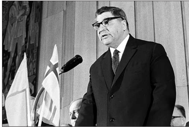
BỘ TRƯỞNG BỘ THỦY SẢN LIÊN XÔ ALEXEI ISHKOV

trưởng Alecxei Kosygin rằng trong thời gian ngắn sẽ tăng gấp nhiều lần dòng tiền vào ngân sách đất nước, nếu như Bộ Thủy sản của ông được quyền giám sát việc bán sản phẩm. Viện dẫn là số chi phí do sự chậm trễ quan liêu đã cản trở Bộ Thương mại bán sản phẩm cá tươi cho người dân khiến cho nhu cầu bị giảm đi. Ông còn đề xuất được trực tiếp lãnh đạo bộ phận bán các sản phẩm cá (từng thuộc thẩm quyền của Bộ Ngoại thương và Nội thương) và Kosygin đã ủng hộ ý tưởng này.