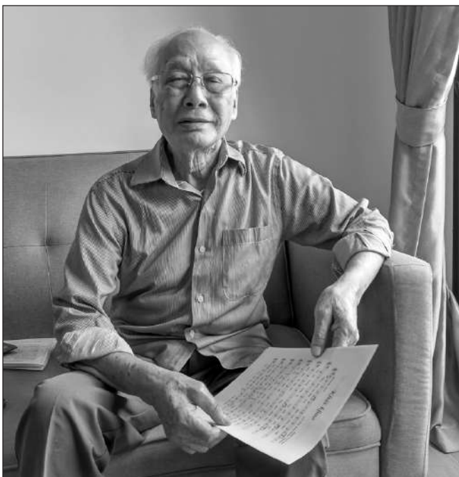
LÀ NGƯỜI KHẢ CẦN THẬN, NHẠC SĨ VĂN KÝ GHI CHÉP TÍ MỈ TỪNG CA KHÚC CỦA MÌNH TRONG CUỐN SỐ