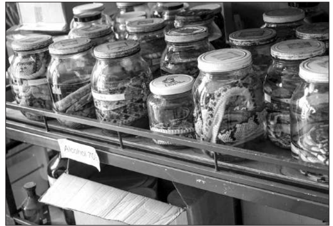
CÁC LO ĐUNG RẮN BẢO QUẢN TẠI INSTITUTO CLODOMIRO PICADO (ICP, COSTA RICA), ĐÚNG ĐẦU THẾ GIỚI VỀ SẢN XUẤT KHÁNG NỌC

Nhờ kháng nọc của ICP mà hiện nay số ca tử vong do rắn cắn đã giảm mạnh ở Costa Rica, dân số nước này hiện nay là 5 triệu người, cứ mỗi 1 hoặc 2 năm mới có người chết do rắn cắn - tỷ lệ tử vong này tương đương với người chết do các tai nạn máy cất cổ ở Mỹ. Nổi tiếng với sự đa dạng các loại đời sống hoang dã, hiện có 23 loài rắn độc đang sinh sống ở Costa Rica, bao gồm loài mãng xà