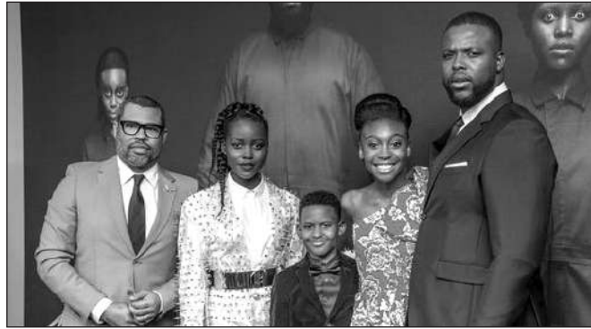
ĐẠO DIỄN JORDAN PEELE (ĐEO KÍNH) VỚI DÀN DIỄN VIÊN DA MÀU TRONG PHIM "US".

"phân biệt chủng tộc ngược" được sự ủng hộ của Ava Du Vernay, đạo diễn các phim "Selma" và "A Wrinkle in Time", người đã viết trên Twitter của mình: "Chúng tôi, những người da đen có quyền không thuê những người làm nhục chúng tôi đã quá lâu".