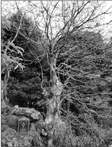
CÂY NGÔ ĐỒNG ĐƯỢC HỘI ĐỒNG CÂY DI SẢN VIỆT NAM CÔNG NHẬN LÀ CÂY DI SẢN

theo bóng thuyền thếp thoáng. Tình yêu, bồn chồn cháy lửa, hóa thành những nhánh ngô đồng đỏ. Người trai ngoài khơi xa, nhớ vợ thương mẹ, ngoài đầu trông về đảo nhỏ, thấy những đốm hoa để ám lòng. Từ trên các triền núi, từng vệt màu đỏ tươi ửng lên rục rờ men xuống tận những đám ruộng khum khum bên dưới. Chất chịu nắng gió, khí trời nơi xứ đảo, những tán hoa mang đến cho vùng đất này một vẻ đẹp mới vừa sinh động lại vừa huyền hoặc.