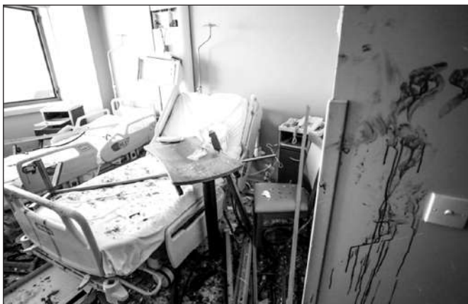
Một bệnh viện bị thiệt hại sau vụ nổ ở Beirut.

"Chúng tôi kêu gọi nhà nước, với tất cả các tổ chức, Tổng thống và Thủ tướng, chính phủ mở một cuộc điều tra tự pháp minh bạch, không trốn tránh sự thật. Để người Lebanon đạt được một cuộc điều tra minh bạch ở cấp độ này, cần phải có sự tham gia của quốc tế, các chuyên gia quốc tế và các ủy ban chuyên môn có khả năng phơi bày sự thật và đạt được công lý cho Beirut và người dân", đơn kiến nghị của các nghị sĩ này có ghi. ■