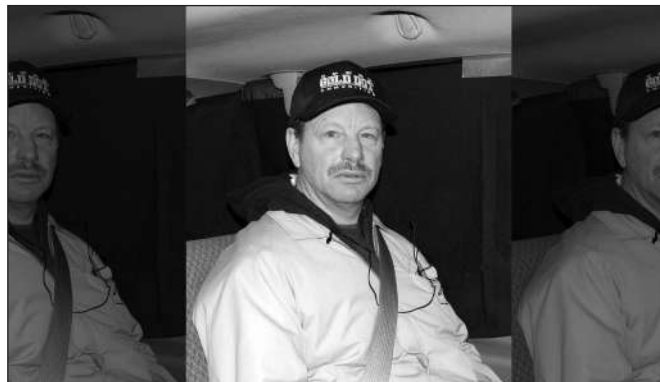
Chân dung Ridgway, kẻ giết người sông xanh.

với một nửa người trần truồng. Khám nghiệm tử thi, bác sĩ pháp y khẳng định cả ba nạn nhân đều bị siết cổ đến chết.