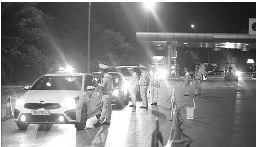
Chốt kiểm tra đêm.

Sau đó, cán bộ CSGT tiến hành kiểm tra giấy tờ xe và người lái xe, đặc biệt là