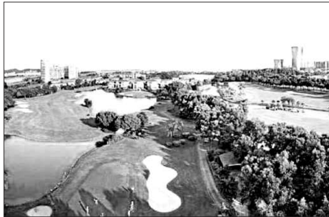
Sân golf của tỷ phú họ Hà

Theo một quan chức nhà nước, ông Hà Hưởng Kiện khác biệt so với thể hệ doanh nhân "đời đầu" của Trung Quốc: "Tôi từng nghĩ ông Hà là một doanh nhân điển hình, thiếu đi tầm nhìn toàn cầu trong việc kinh doanh. Tôi đã lầm. Ông Hà có tư duy vô cùng cởi mở". Theo South China Morning Post, Midea, tập đoàn sản xuất đồ gia dụng từng nhiều lần lọt vào danh sách top 500 Fortune, có tổng doanh thu khoảng 40 tỷ USD với quy mô hơn 150.000 nhân viên trên toàn cầu. Sự thành công của Midea thu hút nhiều cổ đông trong và ngoài nước, bao gồm Hội đồng Đầu tư Kế hoạch Hưu trí Canada. Năm 2008, Midea đã thuê nữ diễn viên huyền thoại của Trung Quốc là Củng Lợi làm đại sứ thương hiệu cùng với một quảng cáo nổi tiếng được phát sóng trên kênh truyền hình quốc gia. ■