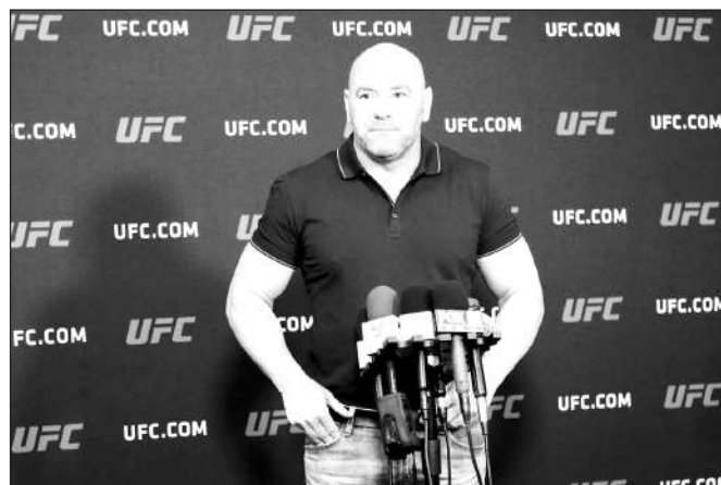
Trước khi trở thành ông bầu quyền lực trong giới MMA, Dana White từng suýt mất mạng vì các băng nhóm cho vay lãi đòi "xử".

Nếu một người muốn trở thành võ sĩ chuyên nghiệp, anh ta cần tìm một promoter