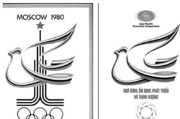
Bức tranh cổ động của họa sĩ Dương Ngân Hải (phải) bị tố là đã đạo tranh của 1 họa sĩ nước ngoài (trái).

Năm 2019, trong một cuộc thi sáng tác tranh cổ động chào mừng 90 năm thành lập Công đoàn Việt Nam do Công đoàn Giáo dục Việt Nam tổ chức, đã có đến bốn tác phẩm đoạt giải khuyến khích của cuộc thi bị tố là sao chép ý tưởng hoặc trùng, nhái một phần nội dung của một số bức tranh đã được công bố trước đó. Mới đây, giới hội họa bắt đầu rộ lên câu chuyện nhiều họa sĩ "tự đạo tranh của chính mình". Không chỉ nhái ý tưởng hay chép tranh của người khác, mà không ít họa sĩ sẵn sàng vẽ đi vẽ lại nhiều lần một bức tranh trước đó của chính mình để bán. Điều này khiến cho không ít nhà sưu tập, nhà đầu giá, người mua tranh giờ khóc giờ cười. Bức tranh mình mua đúng là của tác giả đó vẽ rồi, nhưng nó lại giống hệt một số bức trước đó cũng của chính tác giả bán cho những người khác. Nghệ thuật đã không còn là tính độc bản như định nghĩa vốn dĩ về nó nữa, mà được nhân bản lên nhiều lần chỉ để phục vụ thị hiếu của khán giả, hay đơn giản là túi tiền của nghệ sĩ. Nóng nhất là chuyện một họa sĩ nổi tiếng chuyên vẽ ngựa. Chưa