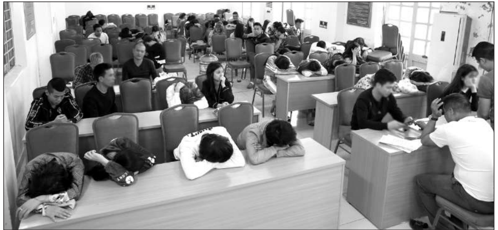
Các đối tượng trong vụ điểm sử dụng thuốc lắc.