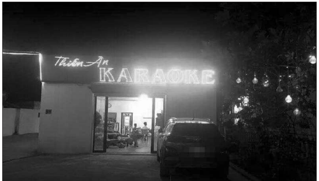
Quán karaoke Thiên Ân.

2h ngày 30-11-2019, Phòng Cảnh sát hình sự Công an TP Hải Phòng phối hợp với Công an huyện Kiến Thụy đã bất ngờ đột nhập; kiểm tra và bắt quả tang tại phòng Vip 1, Vip 2 và Vip 3 của quán karaoke đang tổ chức sử dụng trái phép chất ma túy.