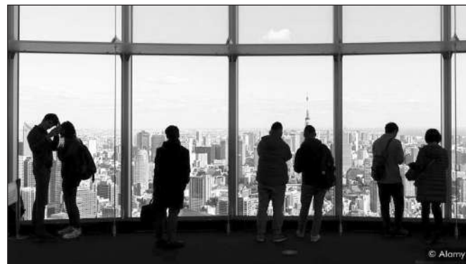
Dịch vụ wakaresaseya đã âm thầm phát triển ở Nhật Bản nhiều năm.

"chuyên gia phá hoại tình cảm" để quyền rũ đối phương, thúc đẩy quá trình chia tay diễn ra êm thấm.