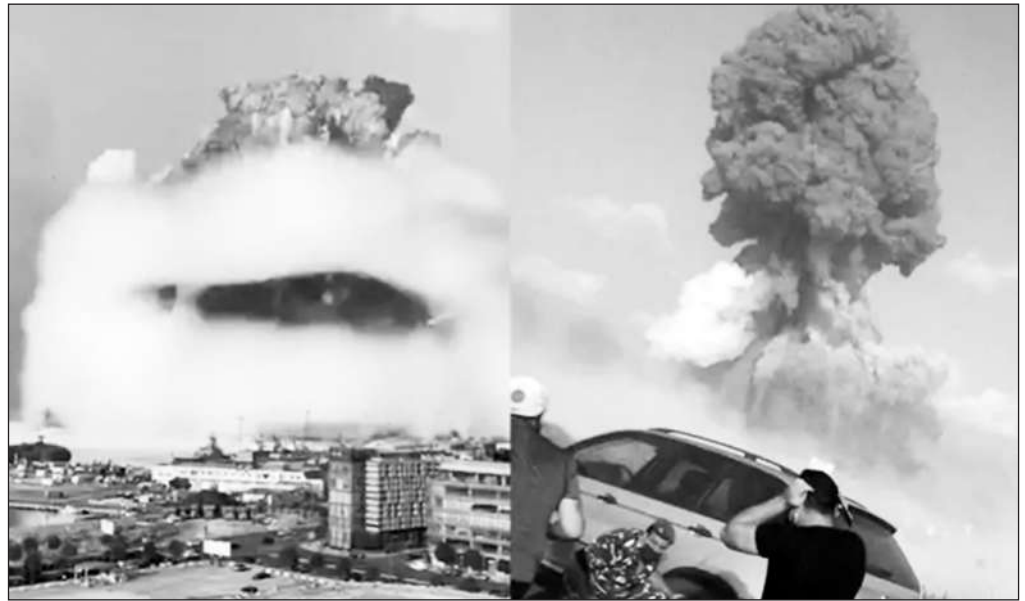
Hình ảnh đám mây nấm xuất hiện ở Beirut sau vụ nổ.

Hiện nay, cuộc điều tra về vụ nổ ở Beirut đang tập trung vào cách mà 2.750 tấn ammonium nitrate gây nổ cao và lý do tại sao không có biện pháp gì được thực hiện về số hoá chất này. Bên cạnh đó, cơ quan điều tra cũng đang xác minh về một bức ảnh lạ được đăng tải trên các trang xã hội vào cuối ngày 5-8, trong đó cho thấy có công nhân đang hàn một cánh cửa kho bên cạnh chỗ chứa khối hoá chất khổng lồ ammonium nitrate. Điều đáng chú ý là cánh cửa và cửa sổ nhà kho trong ảnh trùng khớp với hình ảnh và video của nhà kho nơi xảy ra vụ nổ. Một quan chức Lebanon cho biết, chưa chứng minh được tính xác thực của bức ảnh. Tuy nhiên, một tia lửa từ dụng cụ hàn dù không thể khiến ammonium nitrate phát nổ, nhưng nó có thể đốt cháy các vật liệu khác và tăng nhiệt độ đủ cao để có thể tạo ra vụ nổ lớn.