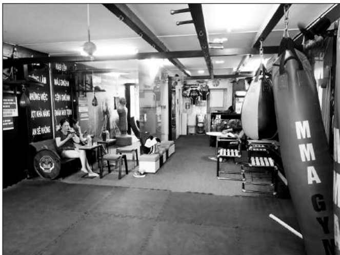
Mở phòng tập MMA khá tốn kém nhưng thu nhập tương đối bấp bênh.

Sự phát triển nhanh chóng của thể loại võ tự do (MMA) không chỉ đặt nền móng cho sự ra đời của Liên đoàn Võ Việt Nam, mà còn tạo trào lưu đầu tư phòng tập, học viện võ thuật... nhằm định hướng, đào tạo nên võ sĩ chuyên nghiệp. Đứng đằng sau những "lò" luyện đó là thế giới của những võ sĩ, HLV và ông bầu - "promoter", một nghề nghiệp mới nhưng vẫn chưa được định hình rõ ràng ở Việt Nam.