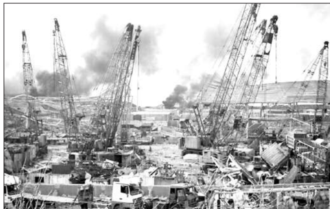
Cảnh tượng ở Beirut sau vụ nổ.

Trong khi đó, tin từ hãng AP cho hay, từ cuối năm ngoái, nhiều đơn thư của người dân đã được gửi lên các cấp có thẩm quyền ở thủ đô Beirut và chính phủ, tố cáo các tệ nạn tham nhũng, lơ là nhiệm vụ ở cảng. Trước đó, Cục trưởng Hải quan Badri Daher còn xác nhận với kênh truyền hình LBC địa phương rằng, có 5 hoặc 6 đơn kiến nghị của ông và người tiền nhiệm cùng một nhóm các chuyên gia đã được gửi đi tới các cơ quan chức năng trong suốt 6 năm qua với yêu cầu là cơ quan tư pháp cho ý kiến để xử lý số hoá chất này. Tuy nhiên, không ai trả lời những đơn kiến nghị này. Cách đây 5 tháng, Cơ quan an ninh quốc gia đã mở cuộc điều tra và chỉ định một