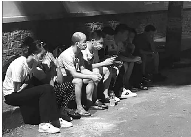
Các trường hợp người Trung Quốc bỏ chạy bị bắt giữ ở địa bàn quận Tân Phú.