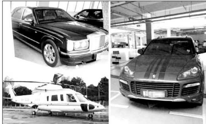
Bộ sưu tập siêu xe và phi cơ riêng của gia tộc họ Hà - Ảnh: Forbes

kiện xe hơi và máy phát điện trước khi nắm bắt xu hướng sản xuất quạt điện vào cuối những năm 1970. Năm 1981, ông đặt tên cho nhà máy sản xuất quạt của mình là Midea và phát triển mô hình hoàn toàn bằng nhựa vào năm 1984. Thời điểm ấy, rất nhiều người dùng sản phẩm này làm quà tặng cho người thân. Năm 1988 là bước đột phá của Midea khi hãng giành được quyền xuất khẩu điều hòa không khí sang thị trường nước ngoài và đạt sản lượng trị giá 120 triệu nhân tệ.