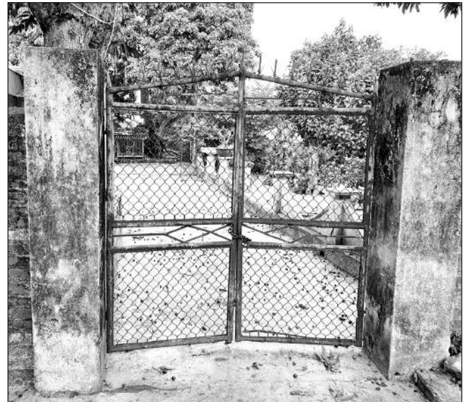
Nhà của bà Hoàng Thị Phượng khóa cửa gần 1 tháng nay.

Người dân địa phương cho biết, giống như các chủ họ khác tại xã An Thắng, bà Phượng là một chủ họ được người dân cho rằng là có uy tín trong nhiều năm. Trong những năm đầu mời chào