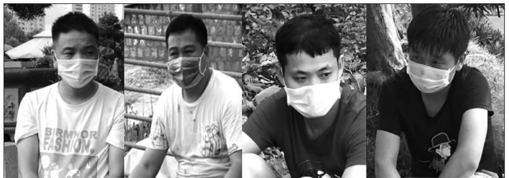
Nhóm người Trung Quốc nhập cảnh trái phép bị bắt ở quận 2.

Không chỉ ở TP Hồ Chí Minh, thời gian qua, tại một số tỉnh, thành như Quảng Ninh, Lạng Sơn, Lào Cai, Đà Nẵng cũng phát hiện người nước ngoài, nhiều nhất là Trung Quốc, vượt biên trái phép vào Việt Nam. Rạng sáng 27-7, Đội Tuần tra kiểm soát giao thông đường bộ cao tốc số 1 thuộc Phòng Hướng dẫn tuần tra, kiểm soát giao thông đường bộ (Cục CSGT, Bộ Công an) thực hiện tuần tra kiểm soát trên tuyến cao tốc Nội Bài - Lào Cai tiếp tục phát hiện năm nam thanh niên quốc tịch Trung Quốc nhập cảnh trái phép vào Việt Nam. Nhóm đối tượng đi từ tỉnh Quý Châu, vượt biên bằng thuyền sang Lào Cai. Khi bị đội tuần tra phát hiện, các đối tượng đang di chuyển trên