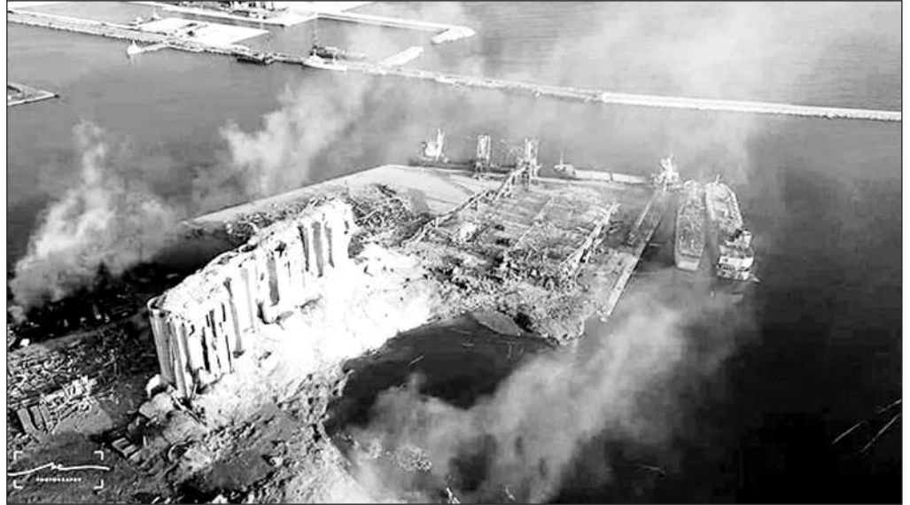
Ảnh chụp từ máy bay không người lái cho thấy cảnh vụ nổ thổi bay một phần thủ đô Beirut, Lebanon.

Theo đoạn video do nhân chứng ghi lại và được tờ The Guardian đăng tải ngày 5-8, sau vụ nổ đầu tiên, một phần của cảng Beirut đã bị hư hại, cột lửa và khói bốc lên cao quá toà nhà 20 tầng. Nhiều người có lẽ cho rằng vụ việc sẽ dừng lại ở đó và đứng quan sát, ghi hình từ xa. Nhưng vài giây sau, vụ nổ thứ hai xảy ra với cường độ gấp