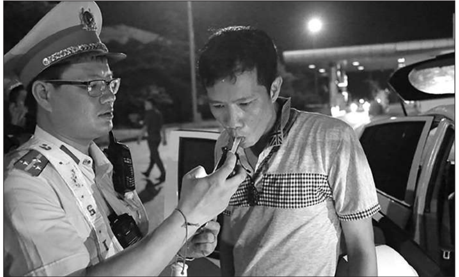
Kiểm tra nồng độ cồn.