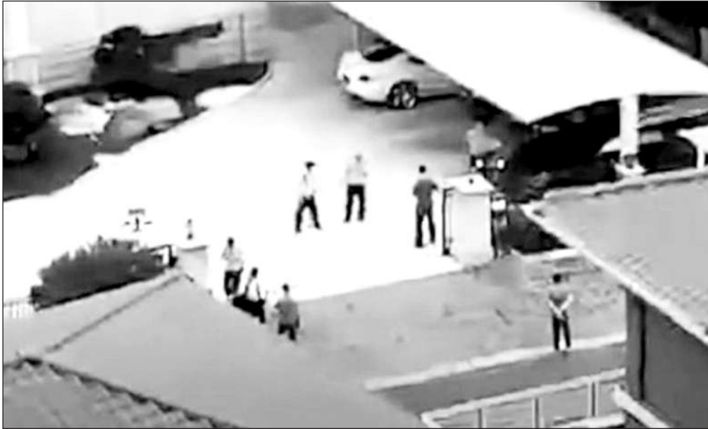
Cảnh sát ập vào giải cứu gia đình tỷ phú He Xiangjian.