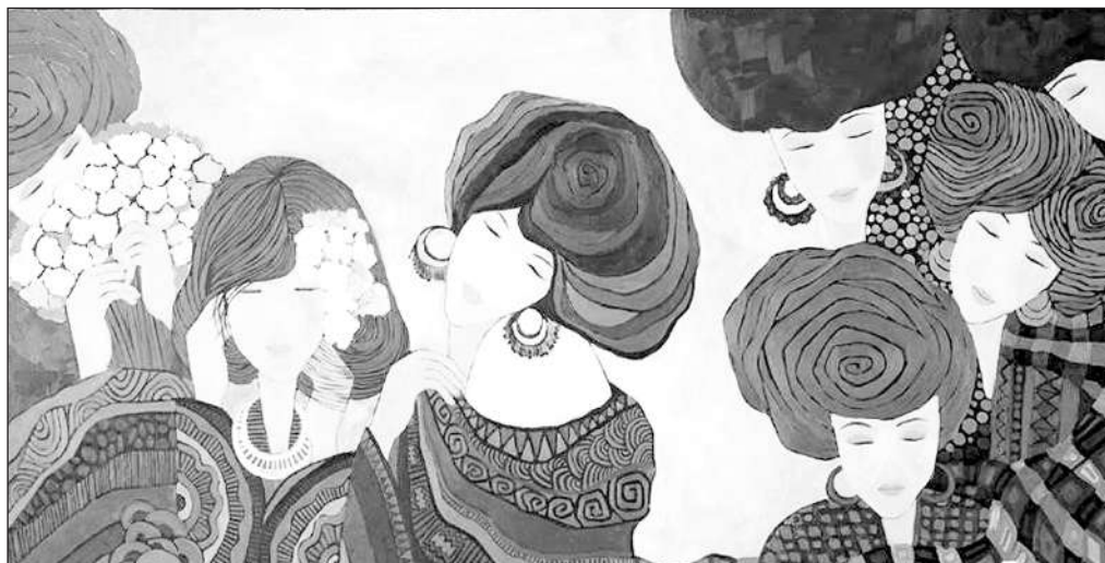
Bản gốc 1 bức tranh của họa sĩ Hà Hùng Dũng từng bị một gallery sao chép bán kiếm lời.