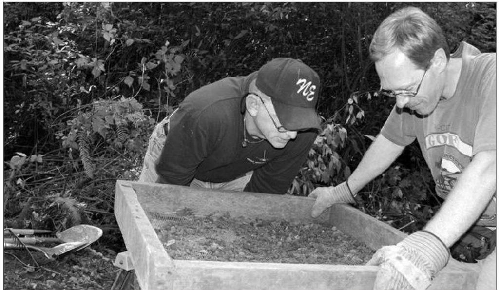
Lực lượng điều tra tìm kiếm hài cốt của một trong những nạn nhân của vụ giết người do Green River Gary Leon Ridgway thực hiện.

Ngày 15-8-1982, một người đàn ông đi câu ở phía Nam sông Green đã phát hiện xác 2 phụ nữ trên sông. Tại đây, lực lượng điều tra phát hiện chân phải thi thể phụ nữ thứ ba