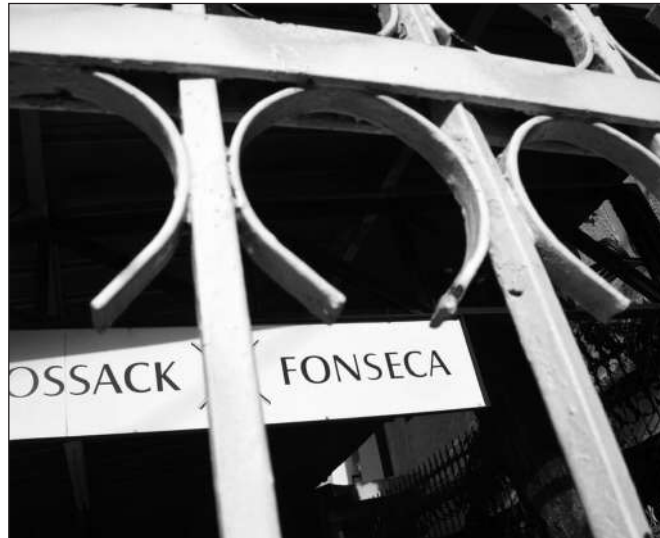
Ảnh chụp bên ngoài trụ sở công ty luật Mossack Fonseca tại Panama đăng tại Toronto Star.

Kojo Annan (tên gọi đầy đủ là Kojo Adeyemo Annan, sinh ngày 25-7-1973), con trai cựu Tổng thư ký Liên Hợp Quốc Kofi Annan (từ 1-1-1997 đến 31-12-2006), bị nêu tên trong thương vụ mua nhà ở London thông qua một công ty ở nước ngoài có trụ sở ở Samoa, đất nước Nam Thái Bình Dương. Theo đó, năm 2004, ông Kojo Annan, đã mua một căn hộ ở thủ đô London, Anh với giá hơn 560.000 USD. Và thời điểm bị công bố, bất động sản này